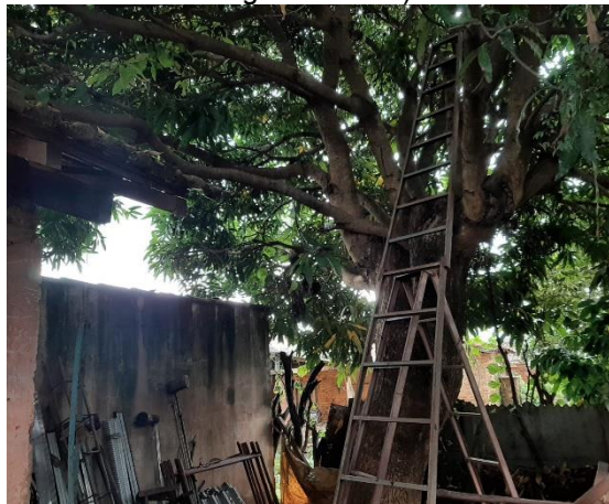
Figura 01: Mangueira (Nome Científico: Mangifera indica ).

Segue o registro fotográfico no momento da vistoria: